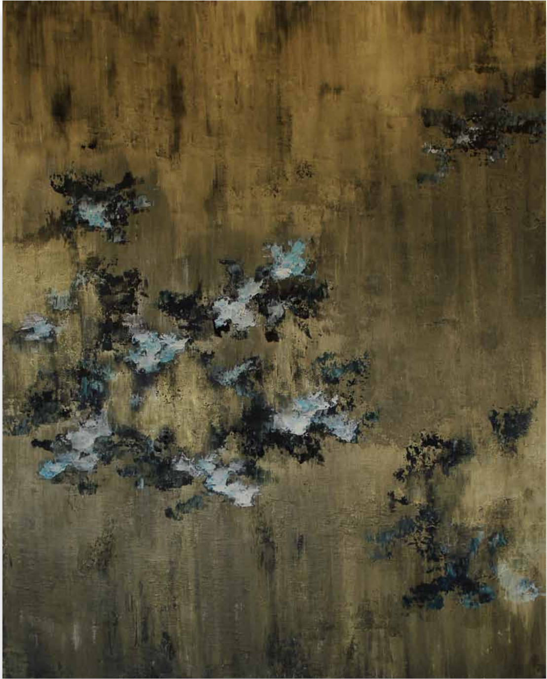
Ciclo de impermanencia dorado. Acrílico sobre tela .140 x 112 cm