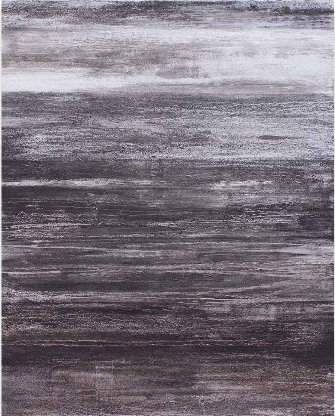
No Lugar. Aluminio, hierro y tinta sobre tela. 140 x 112 cm