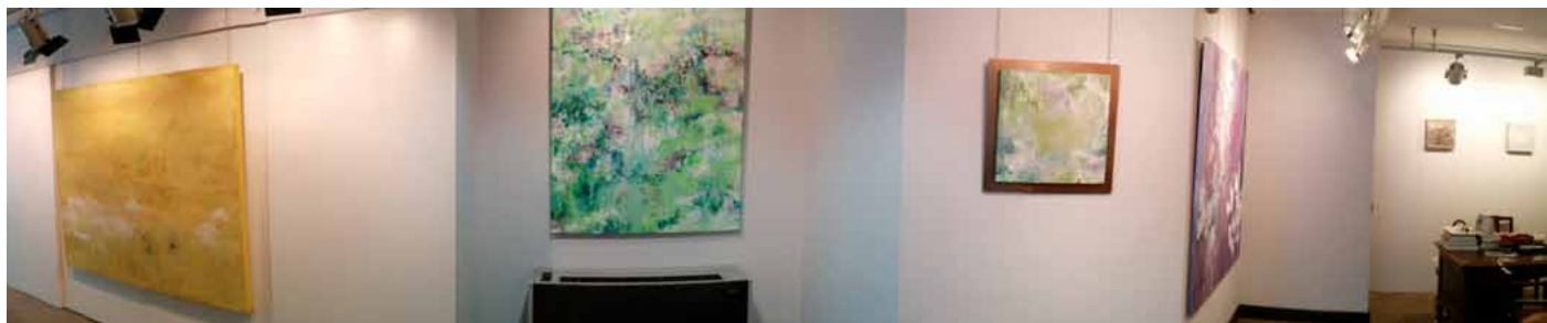
Panorámica Sala 1 Sala exposiciones BBVA.