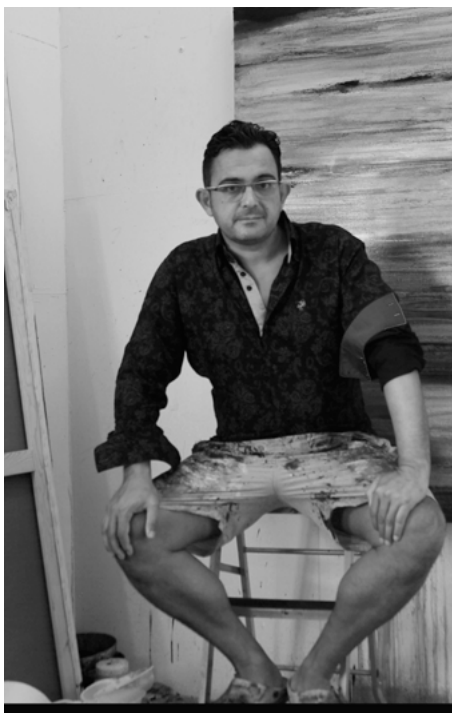
RAFAEL LAMAS Barcelona 1968

Mi trabajo parte del interés en plantear un momento pictórico al observador entre el recuerdo y la presencia, entre un espacio y la atmósfera del mismo. La imagen emerge de la superficie pictórica pero aun no se configura . Es este estadio intermedio, de inconcreción, el que nos permite contemplar la pintura de una manera abierta y no simbólica. En lugar de proyectar nombres o significados, permitimos que la superficie nos sumerja en un mundo con el que compartimos la sensación , una atmósfera lejana que permanece vaga en el recuerdo. Este momento es al que me refería en un trabajo anterior , como hahmottua ( término finlandés para contemplar lo que emerge ).