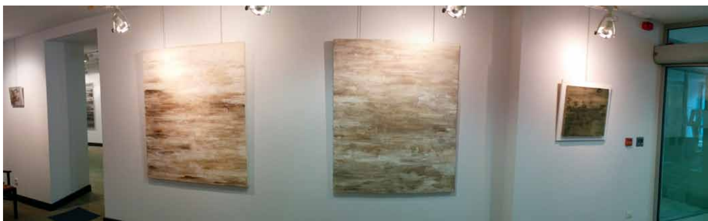
Panorámica Sala 1 Sala exposiciones BBVA.