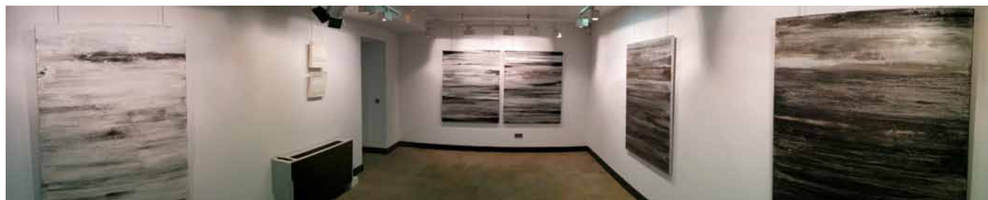
Panorámica Sala 2 Sala exposiciones BBVA.