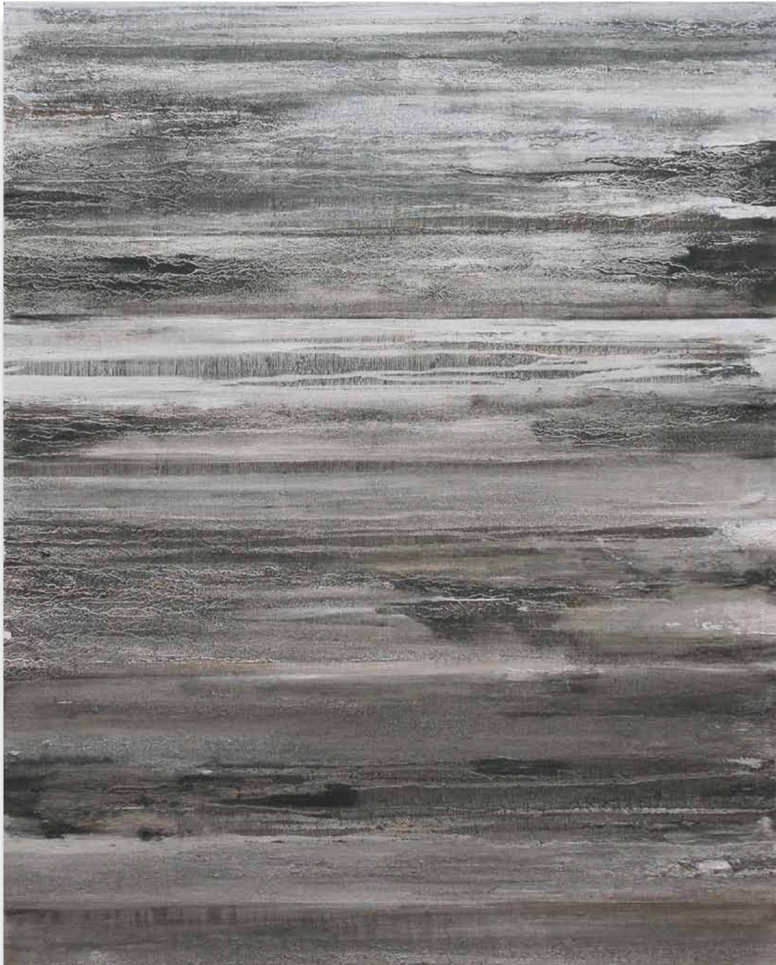
No Lugar. Aluminio, hierro y tinta sobre tela. 140 x 112 cm